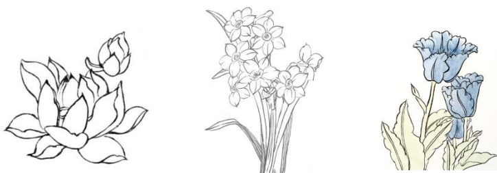
3 séances : Fleurs

Style 《Bai Miao》 : Ce style aux traits précis présente les détails du sujet : la nature, les personnes.